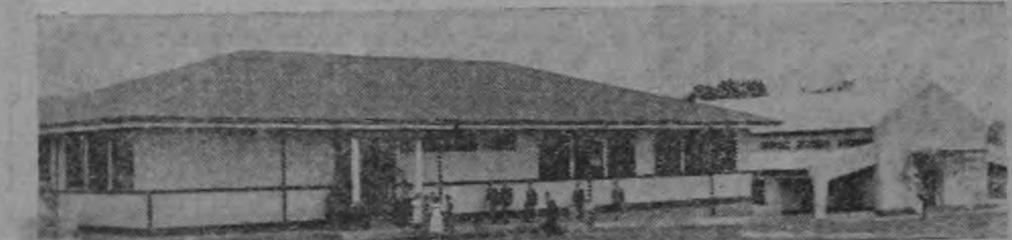
ESCUELA NACIONES UNIDAS.— La Escuela Naciones Unidas será en breve una de las mejores de San José. Aquí pueden observarse dos pabellones ya terminados. Cuando la obra esté concluida, el plantel albergará una población estudiantil de 600 niños.