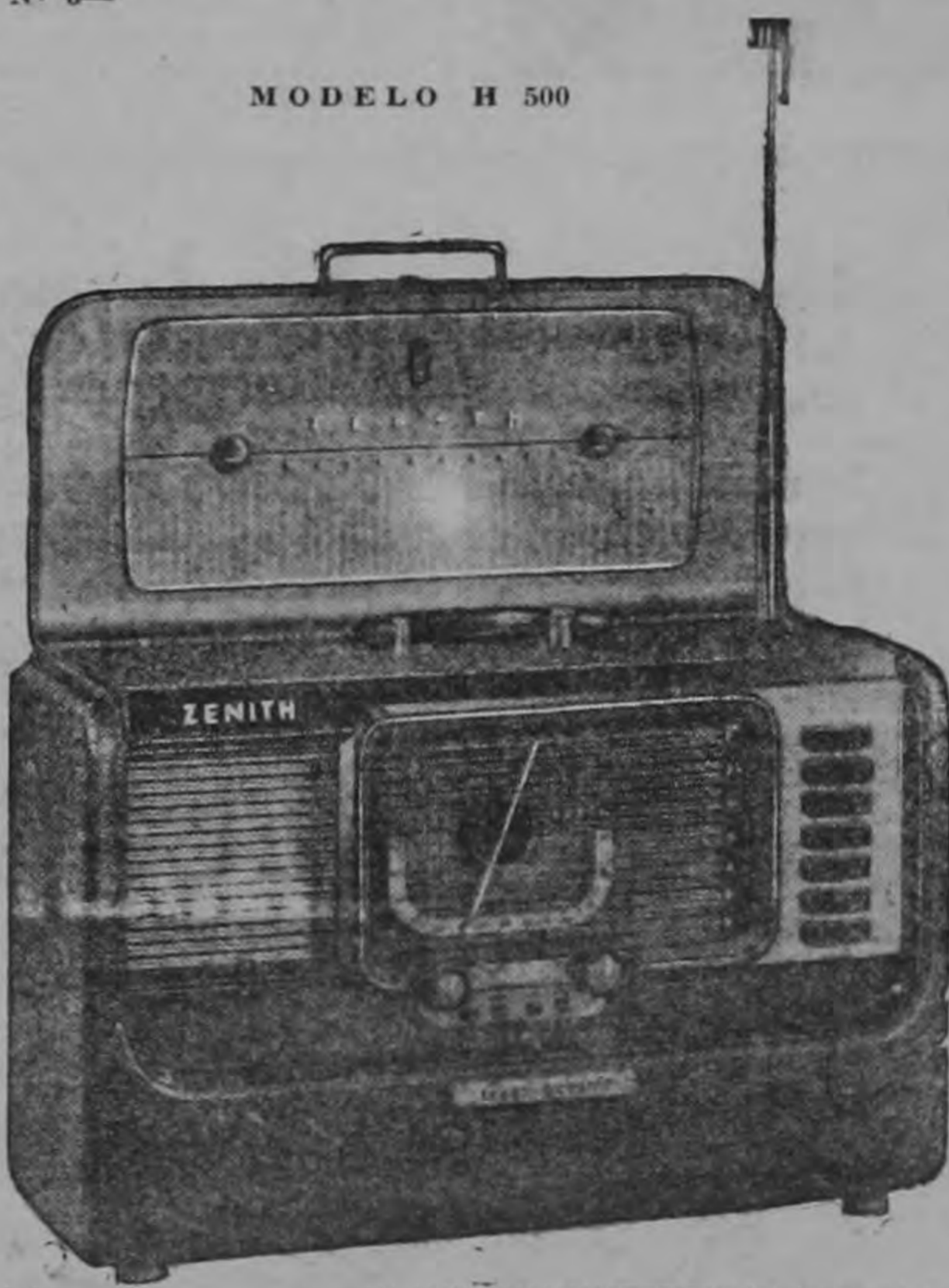
ZENITH "SUPER TRANS-OCEANICO"

El radio portátil de más potencia en su género. Tiene 6 bandas, de onda corta para recepción internacional, además de onda larga. Funciona en barcos, trenes, aviones y hasta en edificios construidos de acero. Para CA/CC o batería.