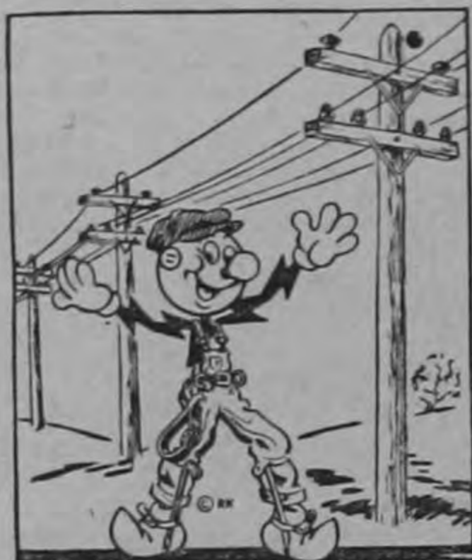
REDDY KILOWATT Su servidor eléctrico

Con motivo de tener que realizar mejoras de urgencia en esta subestación.