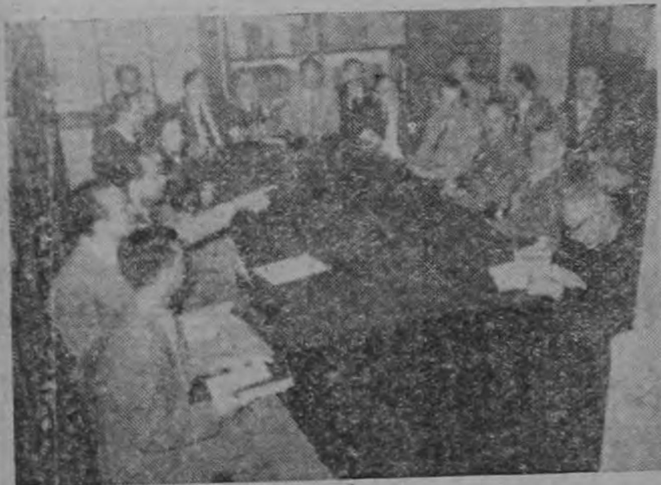
ULTIMA REUNION.— Se clausuran los cursos en la Universidad y ya han comenzado los exámenes de fin de año. Ayer se reunió, por última vez en el año académico, el cuerpo de profesores de la Escuela de Ciencias Económicas y Sociales, ejemplar organización dentro de las distintas divisiones del Alma Máter.

LONDRES, 19 (INS).—El Partido Laborista obtuvo esta noche una prueba pequeña de la opinión pública al ganar unas elecciones secundarias en el distrito de Holborn y St. Pancras en North London.